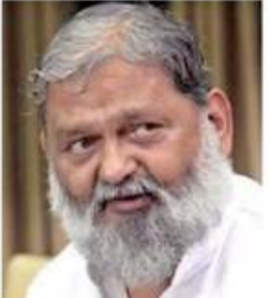
గడదిన రెండురోజులుగా ఈ అల్లర్ల వీరికి తెలుసుకుంటున్న సీనియర్ ఆఫీసర్లు దానిని నిర్మూలన చేశారు.

చందీగఢ్, ఆగస్టు 5: భార్యలారీని సహో అని గన అల్లర్లకు సంబంధించి ఇప్పటివరకూ 202 మంది అరెస్టు చేసారు, మరో 80 మంది ముందుగా అరెస్టు చేసిన తర్వాత తదుపరి వీరిని అరెస్టు చేసారు. మొత్తంగా నుహ్ అల్లర్లకు సంబంధించి 102 ఎఫ్ఐఆర్లు పెట్టబడ్డాయి. ఈ సందర్భంలో బాధ్యులైన 2 వ్యక్తులను అరెస్టు చేసారు. ఇరవై మంది వ్యక్తులను అరెస్టు చేసారు. మరో మంది పోలీసులను అరెస్టు చేసారు. అలాగే పోలీసులను అరెస్టు చేసారు. అలాగే పోలీసులను అరెస్టు చేసారు.