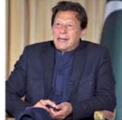
ఈ కేసులో ఖాన్ కు మూడేళ్ల జైలు శిక్ష అంబేద్కర్ కోర్టు తీర్పులు ఇచ్చింది.

ఇమాన్ ఖాన్, ఆగస్టు 5: పోలీసుల మాజీ ప్రధాని, పాకిస్థాన్-ఇస్రాల్ పాకిస్థాన్ ప్రధాని ఖాన్ గగ్గల్ మునింగు ఖాన్ కు మూడేళ్ల జైలు శిక్ష అంబేద్కర్ కోర్టు తీర్పులు ఇచ్చింది. ఈ తీర్పులకు 90 రోజుల్లో ఎప్పటికీ ముగింపు కనిపించదు. ఈ తీర్పులకు 90 రోజుల్లో ఎప్పటికీ ముగింపు కనిపించదు.